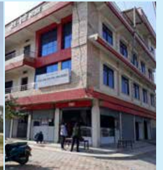
इटहरी आँखा अस्पताल, इटहरी