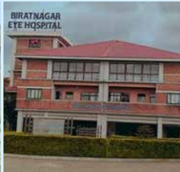
विराटनगर आँखा अस्पताल, रानी, विराटनगर