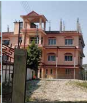
प्रस्तावित मदन भण्डारी आँखा अस्पताल, गाईघाट, उदयपुर (नवनिर्मित भवन)