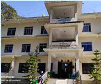
डा. रामप्रसाद पोखरेल आँखा अस्पताल धनकुटा

यस प्रदेशमा मुख्यतया चारवटा आँखा अस्पताल डा. रामप्रसाद पोखरेल आँखा अस्पताल, विराटनगर आँखा अस्पताल, मदन भण्डारी आँखा अस्पताल (नवनिर्मित) र इटहरी आँखा अस्पताल रहेका छन् जसमध्ये यस अंकमा डा. रामप्रसाद पोखरेल आँखा अस्पतालबारे जानकारी गराउनेछौं र क्रमशः प्रत्येक अंकमा संघअन्तर्गतका आँखा अस्पतालबारे जानकारी गराउँदै लानेछौं ।